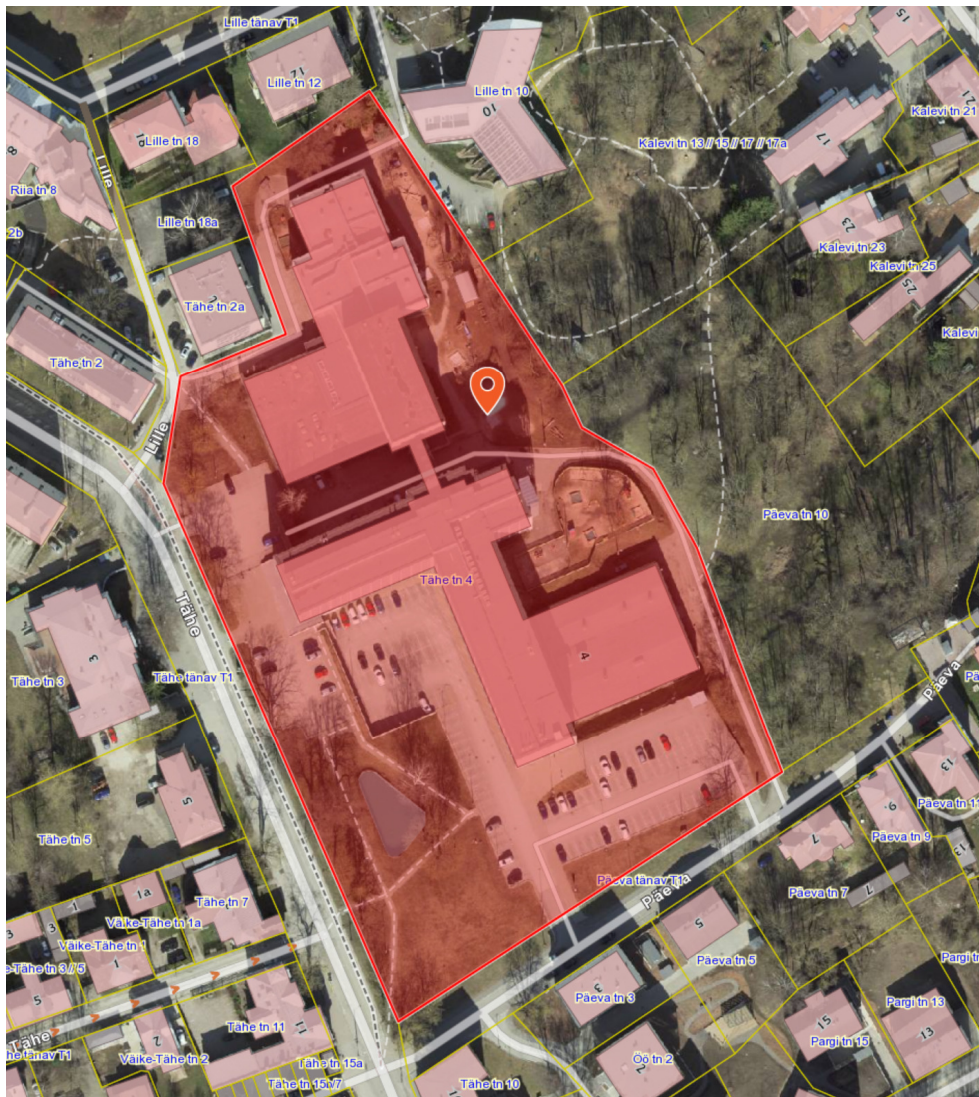
Skeemi 1. Asendiskeem (alus Maaamet)

Käesolevas töös on hinnatud ainult puistu osa. Alustaimestikku ei uuritud, kuna tegemist on niidetavate murualadega. Fotode autor Tanel Breede, fotode kuupäev 06.10.2020.