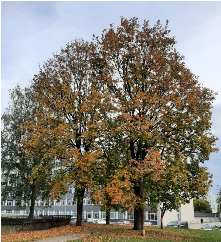
Foto 6. Vahtrad gradiidi juures (puud nr 17,19), paremal all kuivanud tüügas (nr 18)